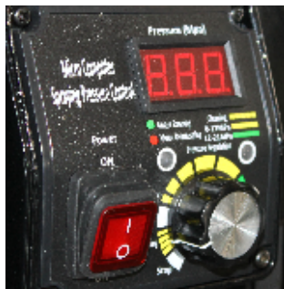
Panou de comanda digital cu micro computer

Utilizare cu 2 operatori / 2 pistoale simultan