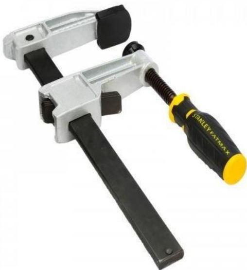
1. - presă manuală de fixare

- Fixați piesa de lucru: Folosiți, pentru fixarea piesei de lucru, prese comercializate în magazine de specialitate. Este mai sigur și vă eliberează ambele mâini pentru operarea mașinii.