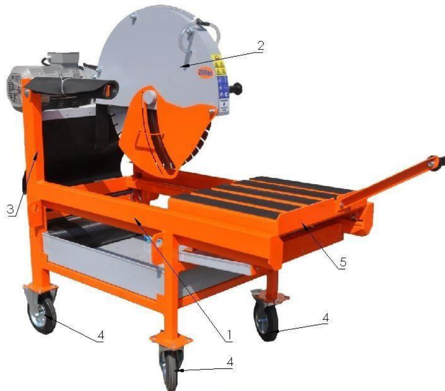
Figura 1. - ZIV KTV 650 E vedere axonometrică din față