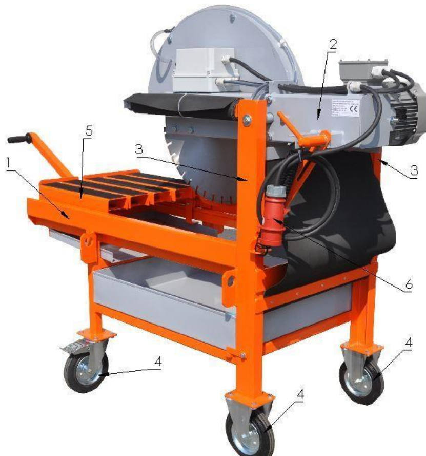
Figura 2. - ZIV KTV 650 E vedere axonometrică din spate