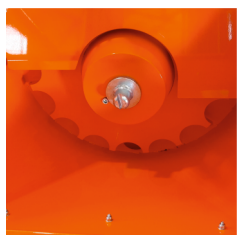
Cuva de material cu roata amestec