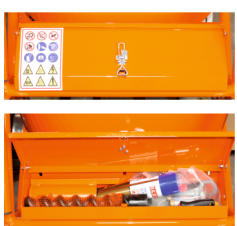
Cutie atasata pe sasiu cu accesorii si produse de intretinere