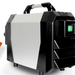
NOU! Compresor DELTA Germania

In lipsa retelei de alimentare, este necesar sa utilizati un generator de curent electric de min. 15 kVA.