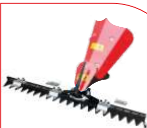
Sistem cosire BTA-GC400 COD: BT7000501 Lățime de lucru 1.200 mm Înălțime tăiere 20-60 mm