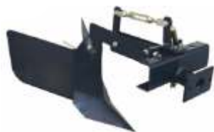
Plug arat BTA-PL400 COD: BT7000506