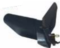
Plug bilonat BTA-SP400 COD: BT7000505