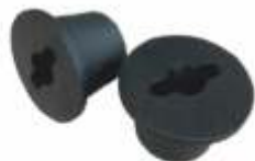
Greutăți roți COD: BT7000508