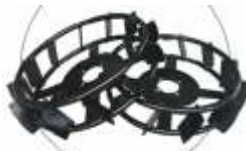
Roți metalice BTA-MW500 COD: BT7000507