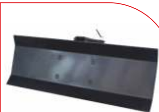
Plug zăpadă BTA-DB400 COD: BT7000503 Lățime de lucru 920 mm