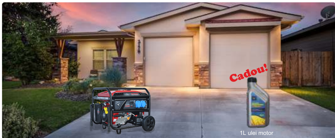
1L ulei motor