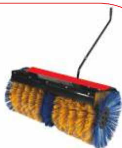
Dispozitiv măturat BTA-SW400 COD: BT7000502 Lățime de lucru 1.100 mm