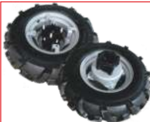
Roți duble cauciuc COD: BT7000509