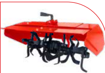
Freză BTA-TI400 COD: BT7000500 Lățime de lucru 800 mm Adâncime 200 mm