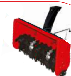
Freză zăpadă BTA-ST400 COD: BT7000504 Lățime de lucru 720 mm