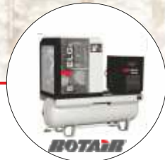
Compresor cu șurub ROTAIR EN07 COD: RT1008405