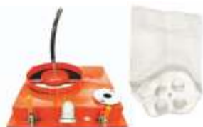
Capac Siloz PCS-K4 403 €