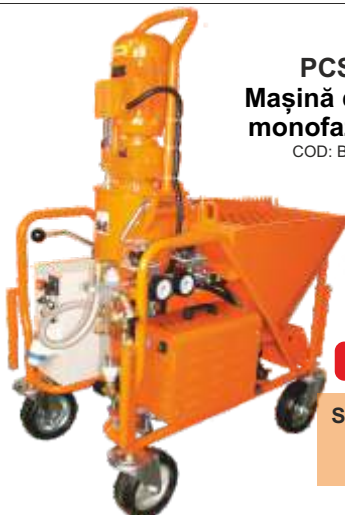
PCS-K35 Mașină de tencuit monofazică 230V

Grătar detașabil cu rupere a sacului 4 roți (2 rotative - 1 cu frână) Stator și rotor D 6-3 Manometru presiune mortar 25 m cablu cu ștecher 15 m furtun material Ø25mm + cuplaje 10 m furtun apă Ø19mm + cuplaje 3/4" (min.2,5 bar) 16 m furtun aer Ø 9,52 mm + cuplaje Lance 70 cm Mixer standard