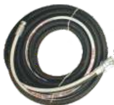
Furtun material Ø25, 15m PCS-K4/K35