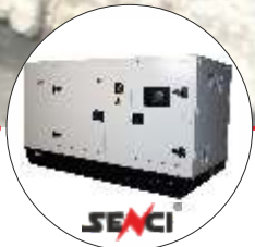
Generator insonorizat Senci SCDE 34i-YS Diesel - ATS si AVR inclus Putere max. 34 kVA, 400V - 50 Hz COD: SC1009404