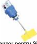
Senzor pentru Siloz PCS-K4 382 €