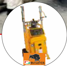
FA60 - Pompă pentru spumă poliuretanică și poliuree COD: BT1008030