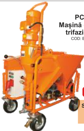
PCS-K4 Mașină de tencuit trifazică 400V