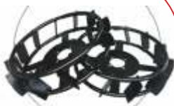
Roți metalice BTA-MW500 COD: BT7000507