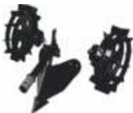
Set roți metalice și plug BTA-SP360 COD: BT7000499 Distanță exterioră roți 420mm