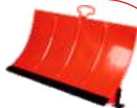
Plug zăpadă BTA-DB360 COD: BT7000497 Lățime de lucru 850 mm Ajustare înălțime 0-50 mm