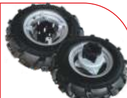
Roți duble cauciuc COD: BT7000509