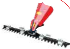
Sistem cosire BTA-GC400 COD: BT7000501 Lățime de lucru 1.200 mm Înălțime tăiere 20-60 mm