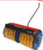
Dispozitiv măturat BTA-SW400 COD: BT7000502 Lățime de lucru 1.100 mm