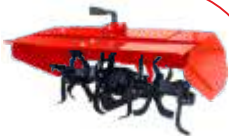
Freză BTA-TI360 COD: BT7000494 Lățime de lucru 620 mm Adâncime 200 mm