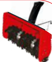
Freză zăpadă BTA-ST400 COD: BT7000504 Lățime de lucru 720 mm