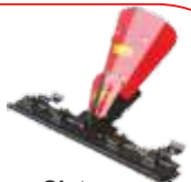
Sistem cosire BTA-GC360 COD: BT7000495 Lățime de lucru 970 mm Înălțime tăiere 20-60 mm