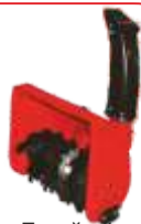
Freză zăpadă BTA-ST360 COD: BT7000498 Lățime de lucru 560 mm Distanța de aruncare 6m