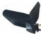
Plug bilonat BTA-SP400 COD: BT7000505