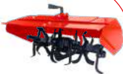
Freză BTA-TI400 COD: BT7000500 Lățime de lucru 800 mm Adâncime 200 mm