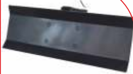
Plug zăpadă BTA-DB400 COD: BT7000503 Lățime de lucru 920 mm