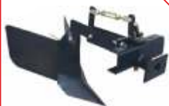
Plug arat BTA-PL400 COD: BT7000506